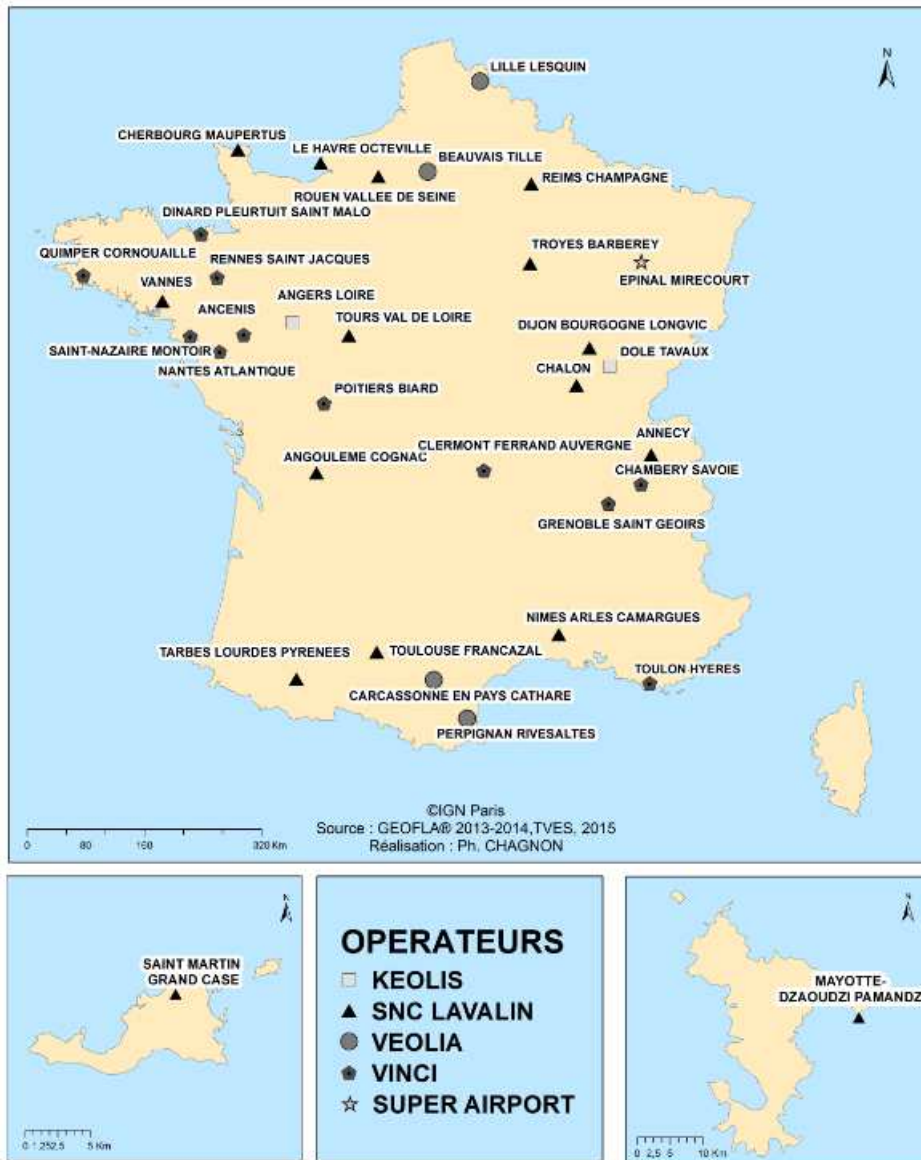
Figure 1 : Aéroports français avec une délégation de service public

Concernant les aéroports régionaux, le premier à être passé en partie dans le giron du privé est l'aéroport de Toulouse-Blagnac. Fin 2014, face aux offres concurrentes d'ADP et de Vinci, l'Etat a choisi de céder 49,9% du capital de la société Aéroport Toulouse-Blagnac (ATB) avec une option dans trois ans sur les 10,1 % restants, au consortium chinois Symbiose, composé de Shandong Hi Speed Group et du fonds Friedmann Pacific Investment Group 25 . Au total, le nouvel actionnaire détiendrait 60% d'ATB 26 .