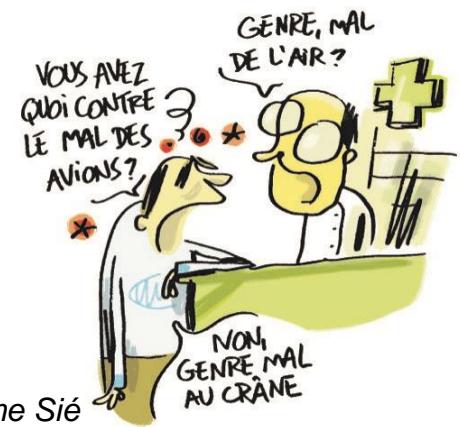
Illustration: Jérôme Sié