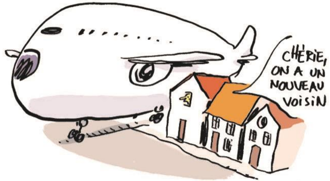
Illustration: Jérôme Sié

L'UFCNA (Union Française Contre les nuisances des Aéronefs) est une fédération agréée au niveau national qui regroupe plus de 60 associations de défense des riverains d'aéroports, aérodromes et héliports. Elle se préoccupe des nuisances sonores et chimiques de l'aviation commerciale, de l'aviation légère, militaire et des hélicoptères ainsi que de leur impact sur la santé des populations survolées.