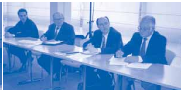
Les élus présents à l'Assemblée générale ordinaire du 15 mars 2005

serait dans la situation où l'on concentrerait tous les vols de nuit au-dessus de quelques villages.