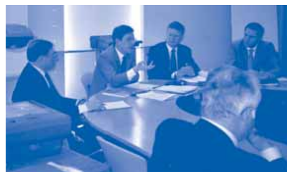
15/03/05 - Assemblée Nationale - Assemblée générale "Ville et Aéroport"

À la deuxième question, la réponse est « oui », même s'il y a des difficultés. L'interdiction totale est une illusion. Si l'on prend l'exemple d'Orly qui applique le couvre-feu entre 23h et 6h, on sait que des dérogations sont accordées pour des vols de nuit donc on